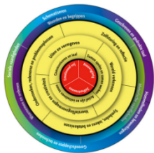
Figuur 1. Cirkel van basisontwikkeling (Startblokken van Basisontwikkeling, n.d.)

Om de kwaliteit van ontwikkelingsgericht handelen optimaal te houden en te verbeteren maken de medewerkers gebruik van de kwaliteitscirkel van Deming. De processen kunnen hiermee nauwlettend gevolgd en aangepast worden waardoor de kwaliteit verbetert. De processen komen ook tijdens teamvergaderingen aan bod. Zie figuur 2.