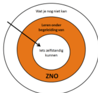
Figuur 4. Zone van naaste ontwikkeling

Hierbij kan de pedagogisch medewerker het kind stimuleren. De pedagogisch medewerker bepaalt door observaties waar de behoefte van het kind ligt en biedt gericht activiteiten aan. Zie figuur 4 De zone van naaste ontwikkeling.