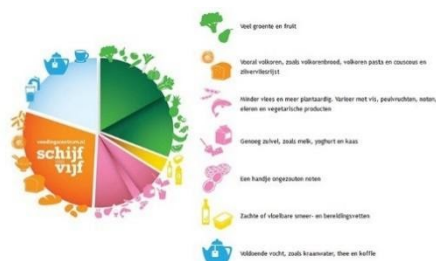
Figuur: Schijf van Vijf Voedingscentrum