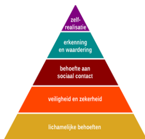
Figuur 3. Behoeftepiramide van Maslow (Piramide van Maslow, n.d.)

Maslow was ervan overtuigd dat een kind altijd eerst alle stappen van de behoeftepiramide moest doorlopen. Als er een stap tussenuit zou vallen, zou er altijd weer opnieuw gewerkt moeten worden aan die stap tot dat er is voldaan aan die behoefte. Stap voor stap bereikt een kind zelfverwerkelijking. (Abraham Maslow, n.d.)